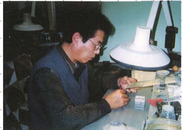
～ベテランの腕のいい職人です～

オーダーメイドやリメイクをお受けすると私共がお客様の 想いや好みをお聞きして数点のデザイン画を描きます。