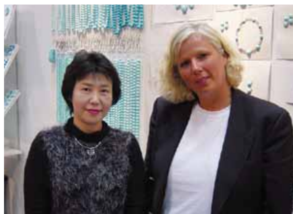
◆ル・コリエ社 デザインセンスもある女性です。