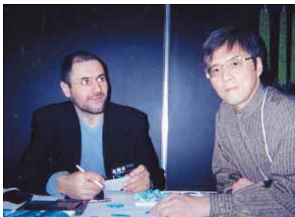
◆イラン ターキス社 品質に自信を持っているので値引きには応じない。