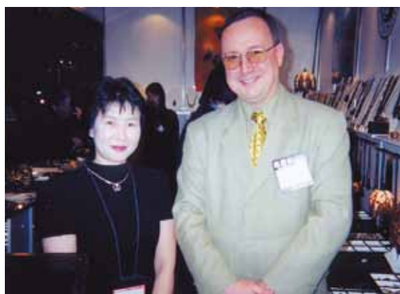
◆ディヴィス社 フランクな人柄で人気の会社。