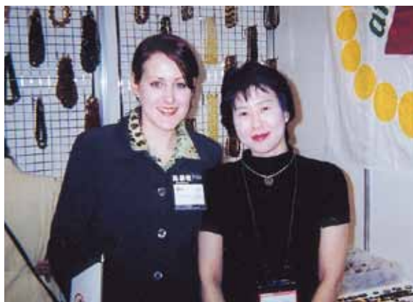
◆ピアータアンバー社 誠実な女性です。