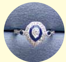
私、TAIKOの指輪 KIMIKOさんと同じ アールデコ調です。