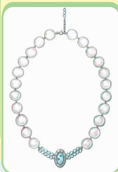
コイン型 厚みがあって大粒