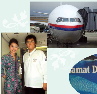
9日間で8回飛行機 に乗りました。