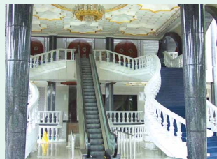
国王と王妃専用の エスカレーター