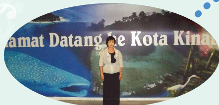
直行便が運休になり、12時間かかって ボルネオの玄関口コタキナバルへ到着