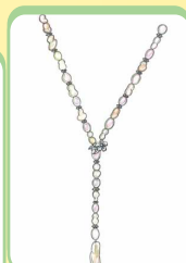
ツインズバロック