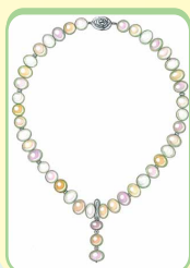
大粒マルチカラー