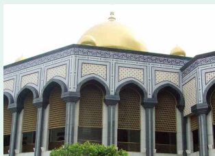
国王の個人資産で建てられた ニューモスク