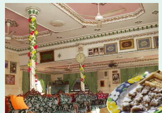
個人のお宅。手造りの 伝統のお菓子を頂く。