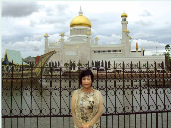
黄金と白亜のオールドモスク。もちろん本物の「金」です。