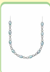
コイン型 シャイニンググレー