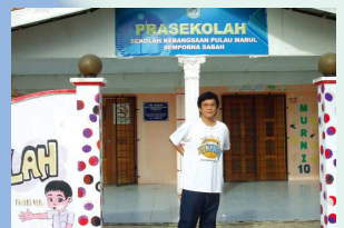
徒歩約1時間位の小さな 島ですが、学校やモスク もあります。