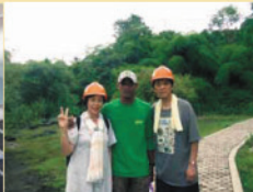
▲フローレス島の洞くつスケールの大きさに感動!