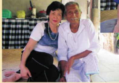
▲ヒーリングを受けて益々パワーアップしました。