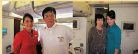
▲ガルダ・インドネシア航空機内で入国審査。到着してからはフリーパス

今回は特に未知との出会いに感動!神々の島で生かされていることに感謝! そして祈りの大切さを学んだ8日間でした。