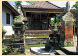
▲祭壇へのお供えを持参して訪問しました。