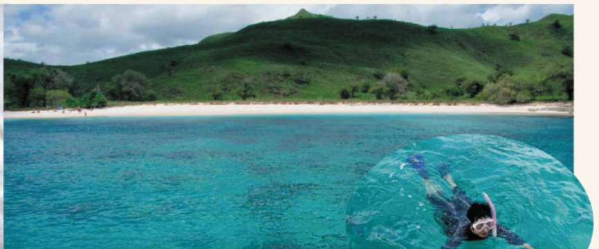
▲コモド島のピンクビーチ 赤いサンゴが流れ着いて砂浜がピンク色。 青い海とのコントラストが美しく夢のようでした。