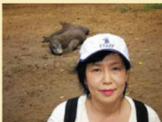
▲こちらはリンチャ島のコモドドラゴンのTAIKOを狙っています。恐竜の生き残りのようなコモドドラゴン。体長3m、体重140kg以上、時速18kmの速さで大型動物はもちろん、人間さえも食べるので超危険。