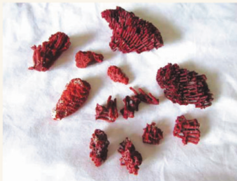
▲ピンクビーチの海岸にあったサンゴ