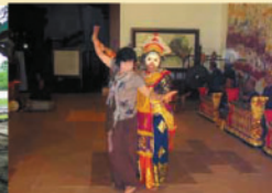
▲舞踊も学びました。