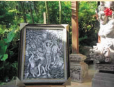
▲デザインも学びました。