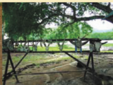
▲コモドドラゴンの餌食になった動物。