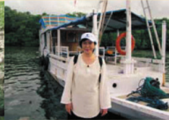
▲フローレス島から小型ボートで5時間かかってコモド島へ上陸。