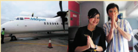
▲フローレス島への飛行機いつも感謝!