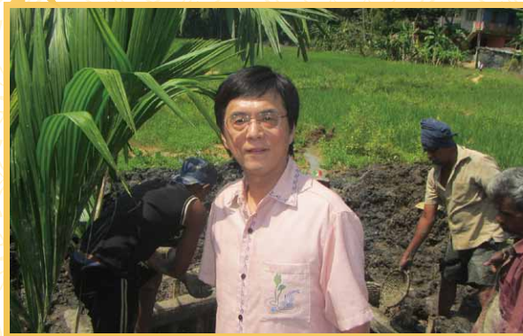
スリランカ宝石採掘場