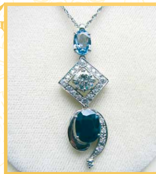
スタイリッシュで エレガントな ペンダントに 変身！