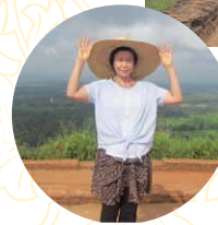
登頂！絶景です。 360度の展望。遠くに アヌラーダプラの 白い仏塔まで 見渡せる。