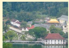
キャンディ湖のほとりに たたずむ仏歯寺。