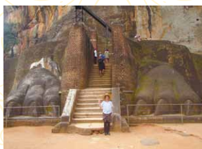
足だけでも巨大さが分かる ライオンテラス。