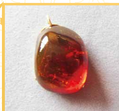
大粒なのでシンプルな ペンダントに。