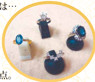
年代物の リング4点。