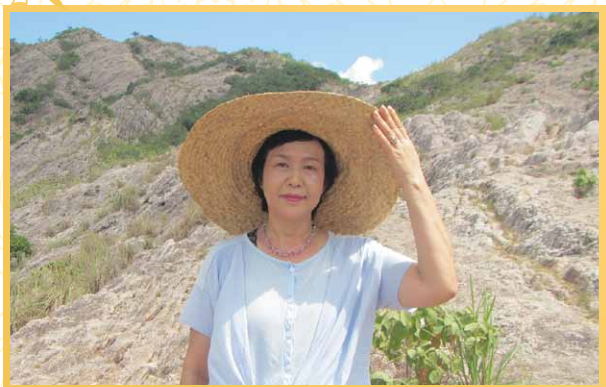
ローズ・クォーツ・マウンテン

文字通り山が全部ローズ・クォーツ(ピンク水晶)で できています。象も出没する太古の森を抜けると 突如現れるパワースポット。