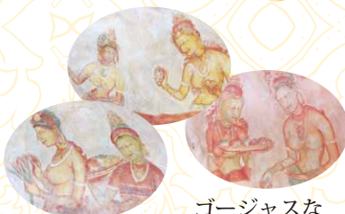
ゴージャスな ジュエリーをつけた美女シギリヤ レディー達。妖艶で神秘的。