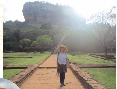
高さ195mの巨大な岩山 ジャングルに眠る空中宮殿。