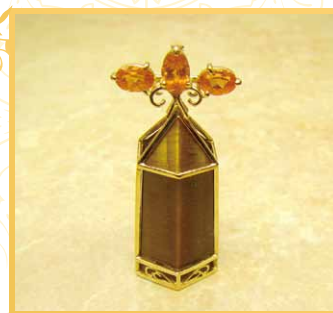
置物にも出来る ようデザイン。 高貴なオーラが 漂います。