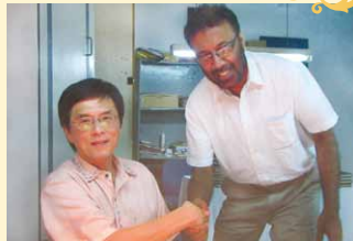
採掘場で交渉成立！