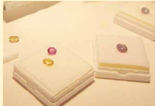
信頼できるオーナー。