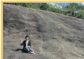
岩山の上でポーズ。